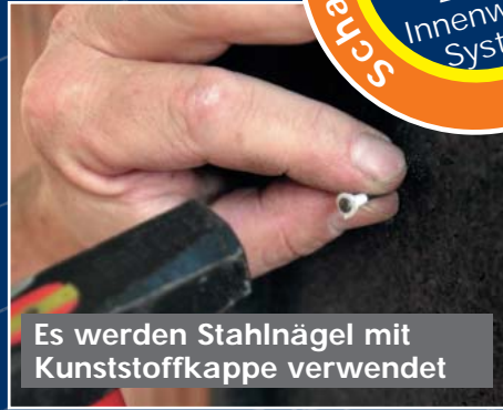
Es werden Stahlnägel mit Kunststoffkappe verwendet