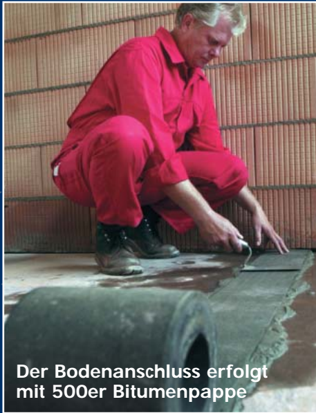
Der Bodenanschluss erfolgt mit 500er Bitumenpappe