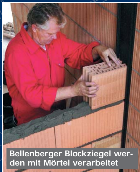
Bellenberger Blockziegel werden mit Mörtel verarbeitet