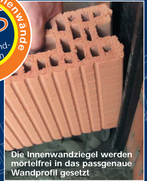
Die Innenwandziegel werden mörtelfrei in das passgenaue Wandprofil gesetzt