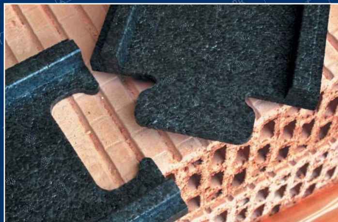
Bild oben: EAP-Profil mit Führungsrand zum passgenauen mörtelfreien Anschluss an der Wand. Bild unten: EAP-Deckenprofil zum Ankleben an der Decke über der Trennwand.

Beim Verputzen ist darauf zu achten, dass die EAP-Profile nicht mit eingeputzt werden, sondern frei und sichtbar bleiben. Beim Streichen oder Tapezieren können die Profile dann überdeckt werden.