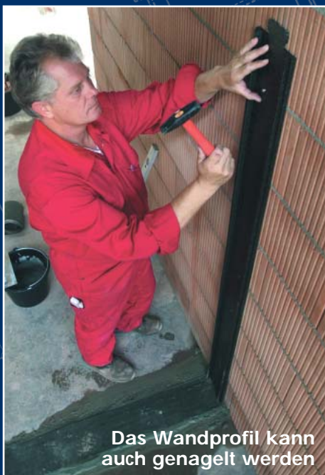
Das Wandprofil kann auch genagelt werden