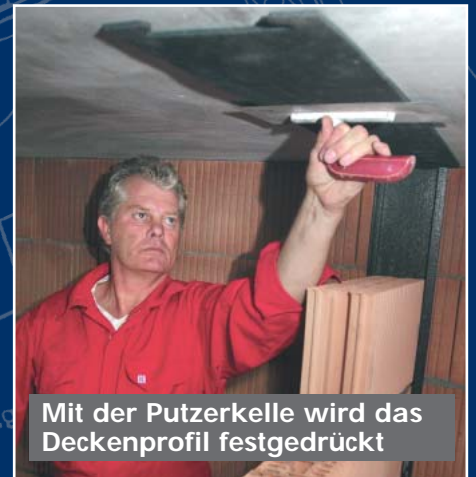
Mit der Putzerkelle wird das Deckenprofil festgedrückt