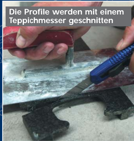
Die Profile werden mit einem Teppichmesser geschnitten