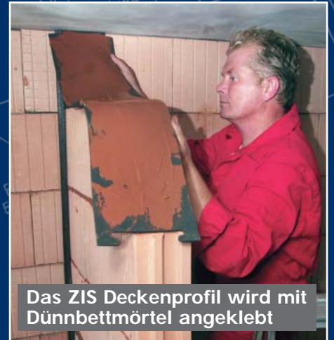
Das ZIS Deckenprofil wird mit Dünnbettmörtel angeklebt