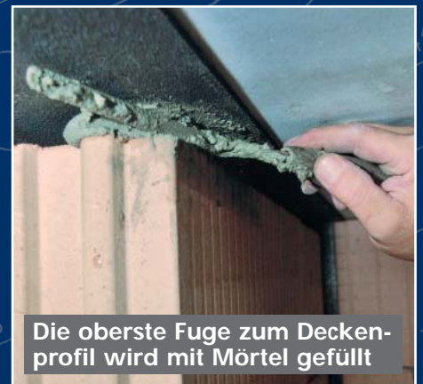
Die oberste Fuge zum Deckenprofil wird mit Mörtel gefüllt