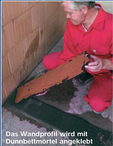
Das Wandprofil wird mit Dünnbettmörtel angeklebt