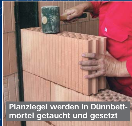
Planziegel werden in Dünnbettmörtel getaucht und gesetzt